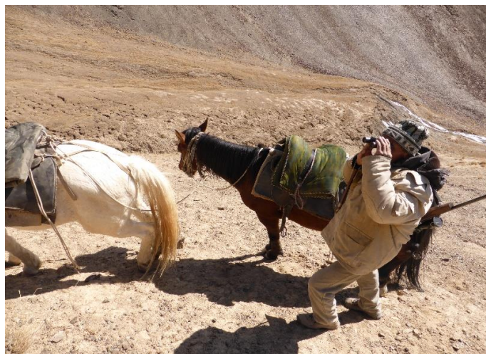
Vi speider omkring i fjellområdene!