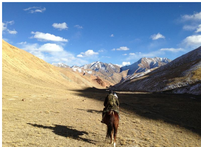
Fantastisk vill natur omgir oss på alle kanter!