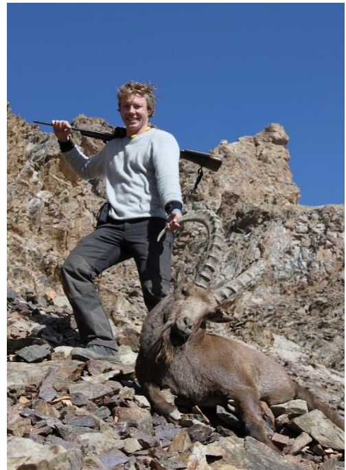
Endelig lønn for strevet!