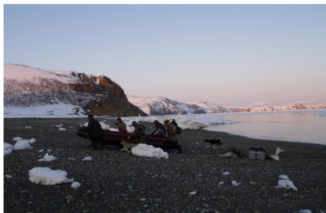
Snart på plass i teltleiren!