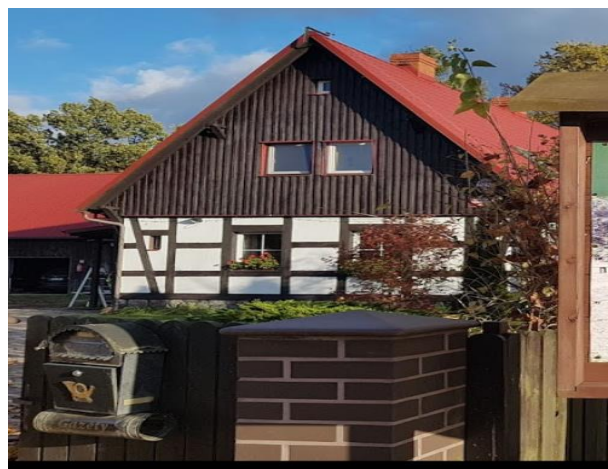
Jaktklubben ligger ca. 69 km fra flyplassen i Gdansk, 256 km fra flyplassen i Szczecin.