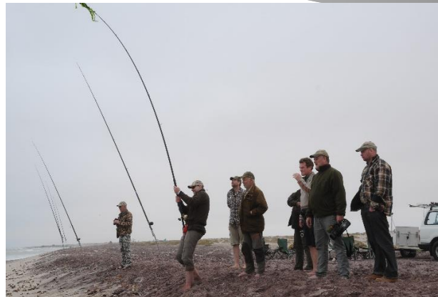
Etter jakten velger mange å prøve hai fiske!