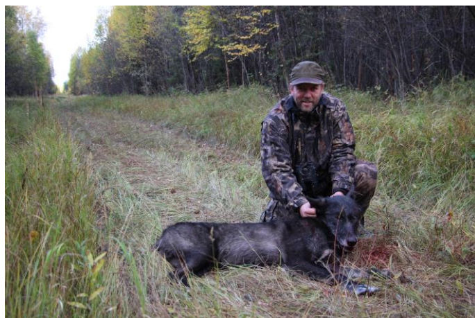
Mylla jeger med svart ulv!